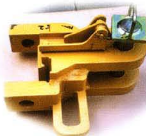
Adaptador Para Implementos

Los costos de Operación y Propiedad son muy competitivos y varían de acuerdo a las condiciones del suelo, superficie, distancias, velocidades y otros factores. El mantenimiento preventivo y los métodos de operación afectan los costos por metro cubico movido. Recomendamos una velocidad mínima de 6 Km/h para cargar la cubeta de la trailla. Las traillas de acabado y afinación pueden operar a mayor velocidad.